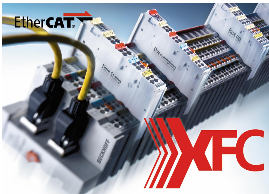
XFC maakt een sample-rate van 100.000 samples/s en hoognauwkeurige distributed clocks met een standaarddeviatie van slechts 20 nanoseconden mogelijk

Beckhoff levert de juiste IPC voor elke oplossing. De high-quality componenten worden door Beckhoff geassembleerd in Duitsland. Ook de productie van moederborden en de ontwikkeling van het Bios voor de IPC's vinden